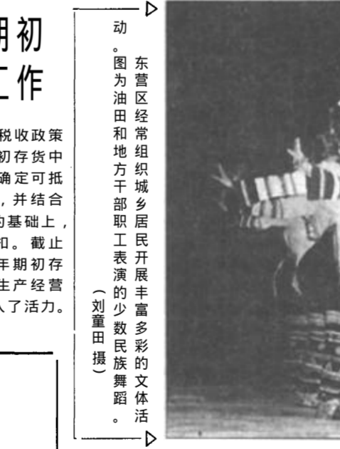
东营区组织城乡干部职工开展丰富多彩的文体活动

眼下虽然时令已至立冬，但是广饶县李东村李东村的村民们却没有感到季节变换带来的寒意，他们朝夕与红花绿叶相伴，将春意挽留在了农家小院。